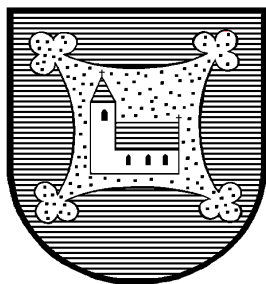
Gemeinde U.Ib.Frau im Walde – St. Felix