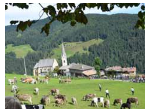
Der Almabtrieb wurde mitten im Dorf gefeiert