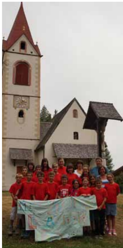
Die stolze Gruppe der Minis Lafreng und ihre Begleiter

Am 6. August war es endlich so weit, wir starteten am Morgen in Laurein und fuhren mit unsern Eltern nach St. Helena, wo wir dann drei erlebnisreiche Tage verbracht haben. Am ersten Tag haben wir uns schon bei einer Wasserschlacht abgekühlt, worauf eine spannende Olympiade folgte. Dabei kämpften die Best Princess, die Timer und die Kochtopfgang um den ersten Platz. Danach war es höchste Zeit fürs Bett, für die meisten gab es auch ausreichend Schlaf. Am nächsten Tag starteten wir früher als geplant, aber trotzdem munter in den zweiten Tag. Diesen haben wir bunt gestaltet und uns verkleidet. Am Nachmittag machten wir eine kleine Wanderung zur Alm. Als wir dann zurückkamen und das Spiel Weerwolf entdeckten, konnte niemand mehr von dem Spiel genug bekommen. Als wir schließlich Holz suchen gingen um ein Lagerfeuer zu machen, wurden wir von unbekannten Besuchern gestört. Sie haben sich erlaubt uns die Fahne zu stehlen und uns mit Pfeilen als Hinweis durch den Wald zu jagen bis wir die Fahne schließlich unter