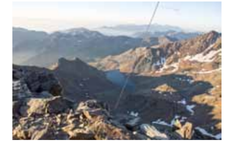
Wunderschönes Panorama in der Bergwelt

Im Oktober durften wir den Jugendraum eröffnen. Der 8. September war es ganz genau, ein Sonntag. Dank allen, die für das Werk einen Beitrag geleistet haben.