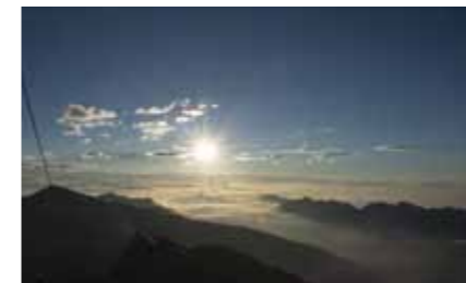
Ein strahlender Sonnenaufgang in den Bergen

ren plötzlich ein paar unserer tapferen Geher von Schwäche befallen oder von Lustlosigkeit oder wollten sie ganz einfach den Tag ruhig und gelassen angehen? Sei's drum. Wir teilten uns in zwei Gruppen; jene, die dablieben und jene, die weitergingen. So erreichte die Truppe zu Mittag den Gipfel auf 2.957 Meter. Wenn man da nur noch den Laureiner Kirchturm draufsetzen würde, wäre die runde Zahl 3.000 herausgekommen. Nach kurzer Rast stiegen wir anfangs auf demselben Pfad wieder hinunter ins Tal und trafen die restlichen, inzwischen ausgeruhten und glücklichen „Hüttenlagerer“. Weiter gingen wir talabwärts