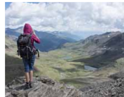
Solche Eindrücke möchte jeder bestmöglich festhalten