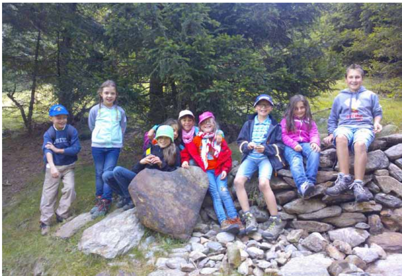
Ein Teil der heurigen Jungschartruppe

Im September startete die Katholische Jungschar mit einer Wanderung. Da wir hier einen tollen Erlebnispfad haben, entschieden wir Jungscharleiterinnen uns dafür, mit den Kindern diesen vom Hofmahd aus zu gehen. Das Wetter war super und wir haben während des Wanderns auch gesungen. Nach einem erfrischenden Holundersaft auf der Kesselalm ging es immer weiter bis ins Dorf. Es war ein schöner Einstieg ins Jungscharjahr 2013/2014, da unsere Jungscharkinder sich sehr gerne in der Natur aufhalten.