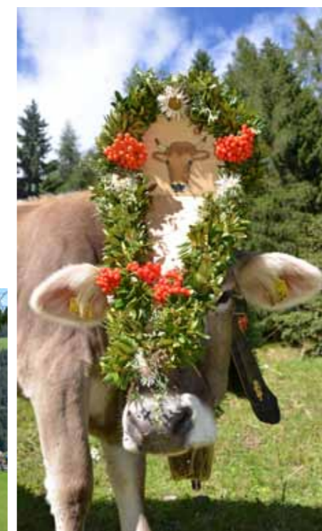
Prächtig geschmückte Kalbin