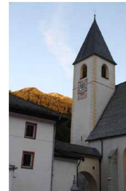
Wege der Kraft führen nach Unsere Liebe Frau im Walde

Attraktivität der Region weiter erhöhen und zwar durch Maßnahmen wie die Errichtung und Vermarktung des Badlwegs, durch die Wiedererrichtung eines der historischen Heilbäder, wobei jenem im Mitterbad eine ganz besondere Stellung zukommt, durch beispielsweise Organisation und Abhaltung einer jährlichen Veranstaltung zum Thema usw. Auch der zweite Teilaspekt zum Thema