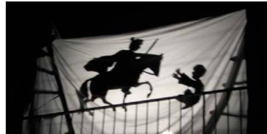
Schattenbild vom Hl. Martin und dem Bettler auf der Terrasse des Kindergartens

Das Kinderteam bedankt sich auf diese Weise nochmals recht herzlich beim KVW St. Felix, der Grundschule St. Felix, sowie der Kindergartenköchin für die gute Zusammenarbeit.