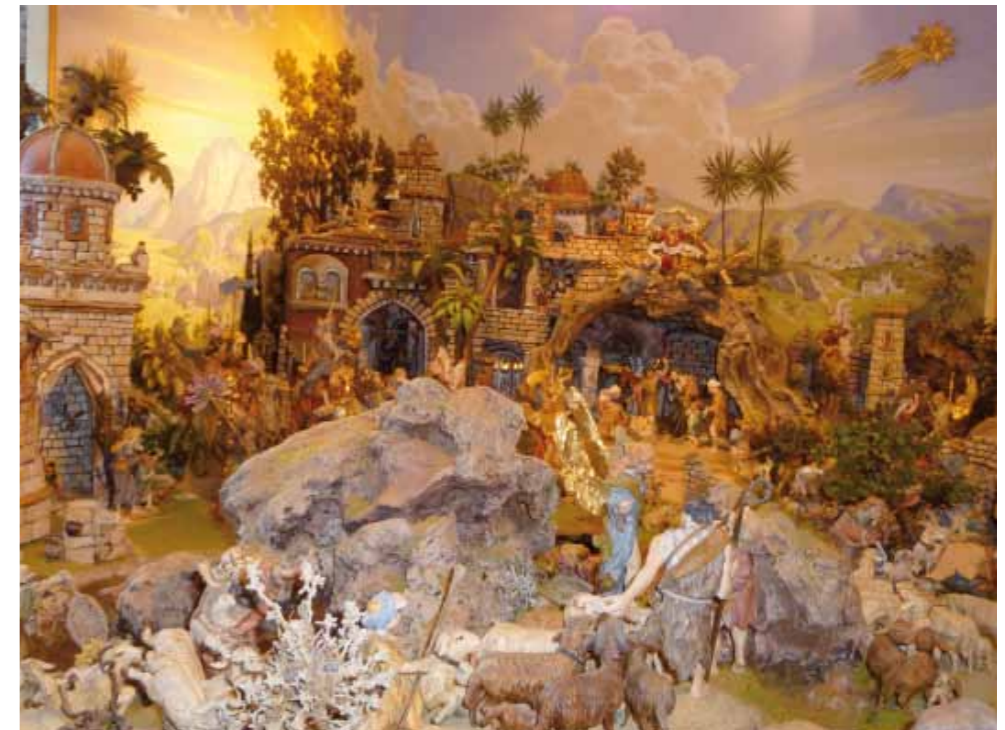
Hauskrippe (Grösse 285 x 145)

setzt. Die zur Schau gestellte Vielfalt laden die Besucher ein zum Verweilen und zum Betrachten, zum Besinnen auf die Bedeutung des Weihnachtsfestes. Der Leitspruch des Krippenvereins Axams „Gloria et Pax“ (Ehre und Frieden) möge allen Besucher in Erinnerung bleiben um zur Ehre des in der Krippe menschgewordenen Gottessohnes und zum Frieden untereinander beitragen. Die Ruhe und Besinnung vor der Krippe sind ein großes Anliegen aller Krippen-