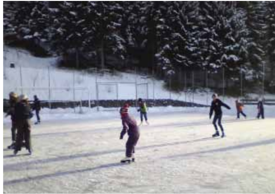
Übung macht den Meister!