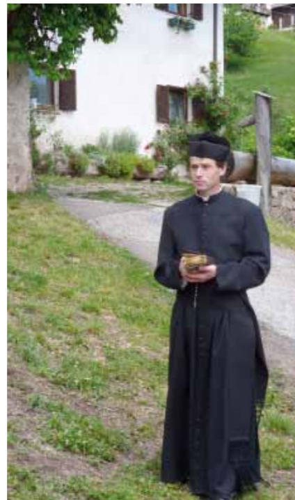
Neue Bildungsorte Geburtshaus Ungern