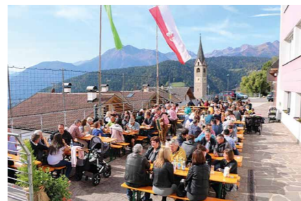
Bei herrlichem Wetter, genossen die Besucher die Mittagsstunden auf dem Fest

In diesem Sinne gilt ein Dank, an die Gemeindeverwaltung von Laurein,