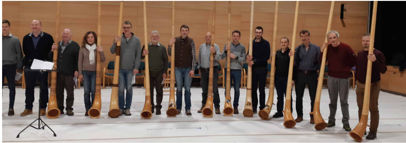
Die Alphornbläser kamen aus dem Burggrafenamt, aus Kaltern, Platt/Passeier und von der Seiser Alm.