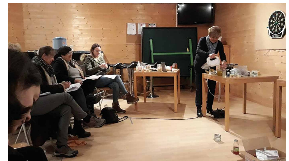
Teilnehmerinnen und Referentin