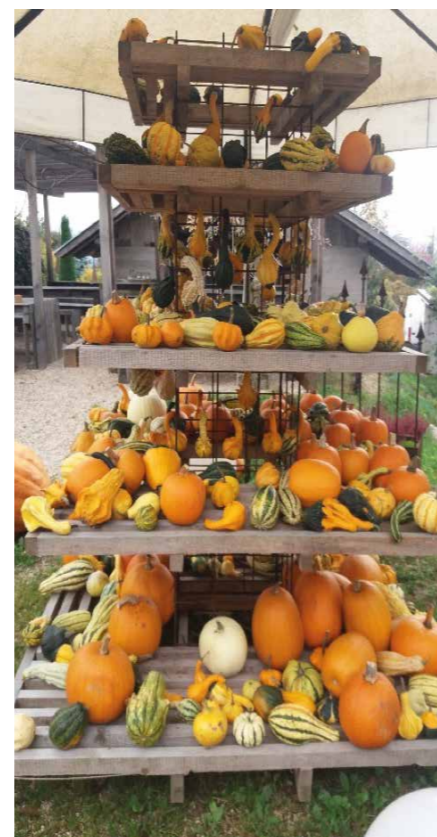
Kürbisausstellung am maso Plaz