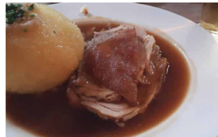
Typisches Münchner Gericht: Ofenfrischer Schweinebraten mit Kruste, dazu Münchens größter Kartoffelknödel