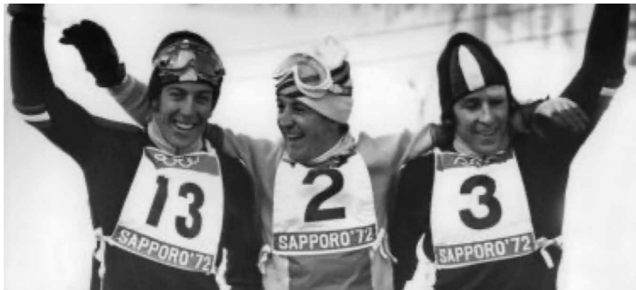
Siegerbild des olympischen Slaloms in Sapporo 1972, von links nach rechts: Gustav Thöni, Luis Fernandez Ochoa, Roland Thöni

Wir schreiben das Jahr 1972 und erinnern uns zurück an die Winterolympiade in Sapporo - Japan. Die sportlichen Erfolge dieses begnadeten Skifahrers und seines Cousins Roland au Trafoi im Vinschgau waren damals in aller Munde. Gustav Thöni errang bei diesen Olympischen Spielen die Goldmedaille im Riesentorlauf und die Silbermedaille im Slalom, Roland war mit dem Gewinn der Bronzemedaille im Slalom erfolgreich. Den Slalom gewann der Spanier Luis Fernandez Ochoa. Wir Kinder wollten diesen Skiikonen natürlich nacheifern. Allzu gerne hätten wir sie aber auch einmal im Fernsehen gesehen. Aber wo? Soweit ich weiß, gab es damals in Pro-